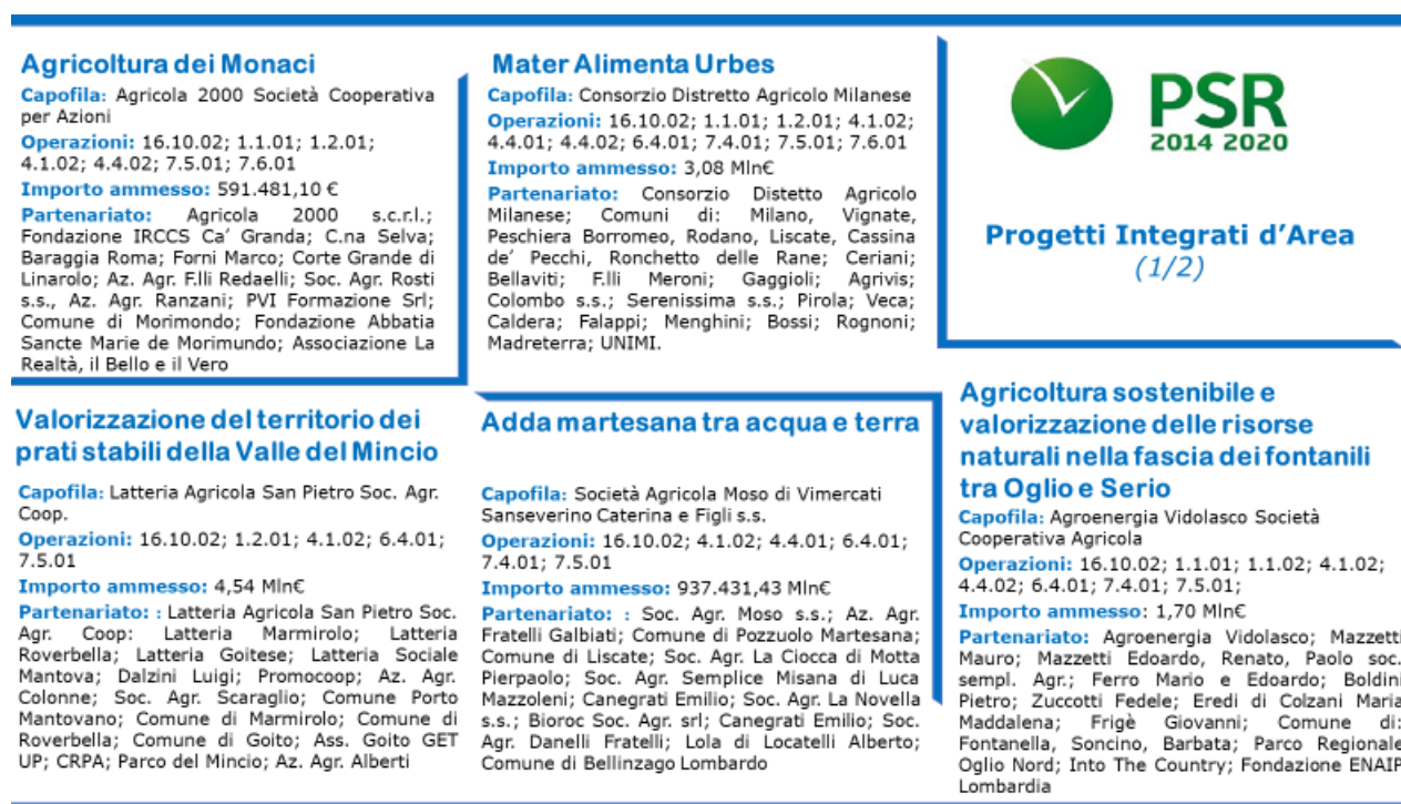
Figura 3 I PIA e le partnership.

La compagine delle partnership di ciascun Progetto Integrato di Area è illustrata nelle figure seguenti: